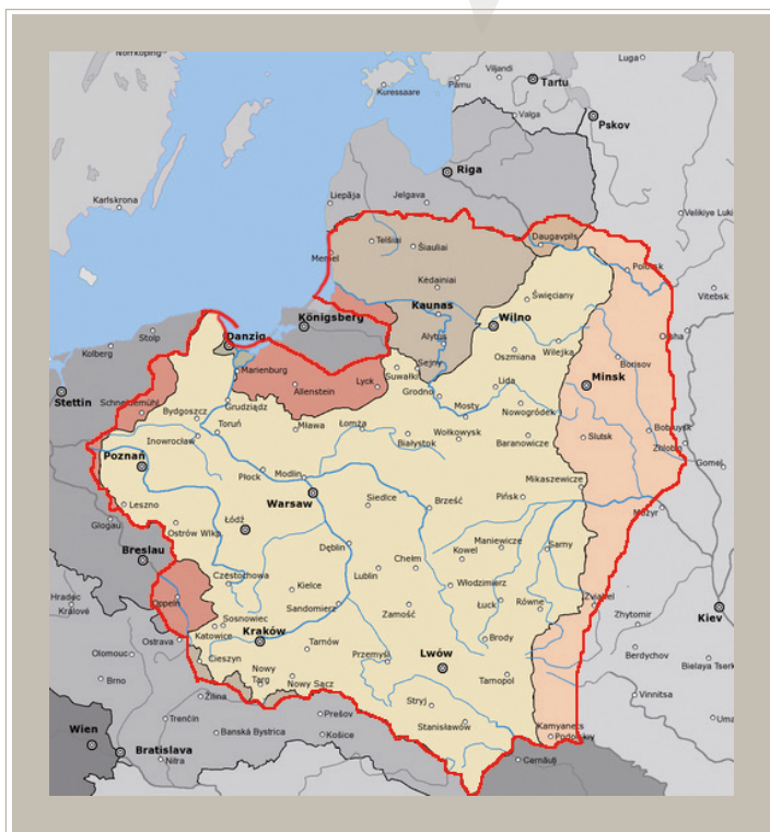
Propozycja granic odrodzonej Polski, zgłoszona przez Romana Dmowskiego na Konferencji w Wersalu w 1919 r.