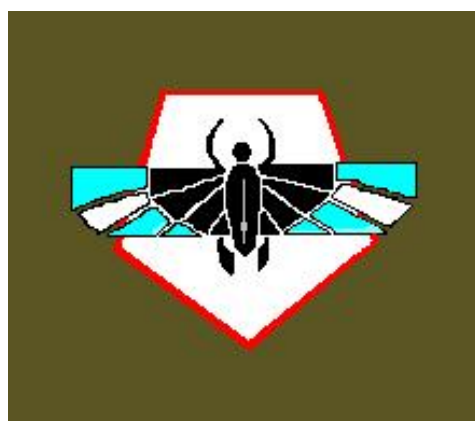
23 Eskadra Obserwacyjna