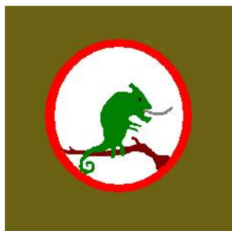
66 Eskadra Towarzysząca