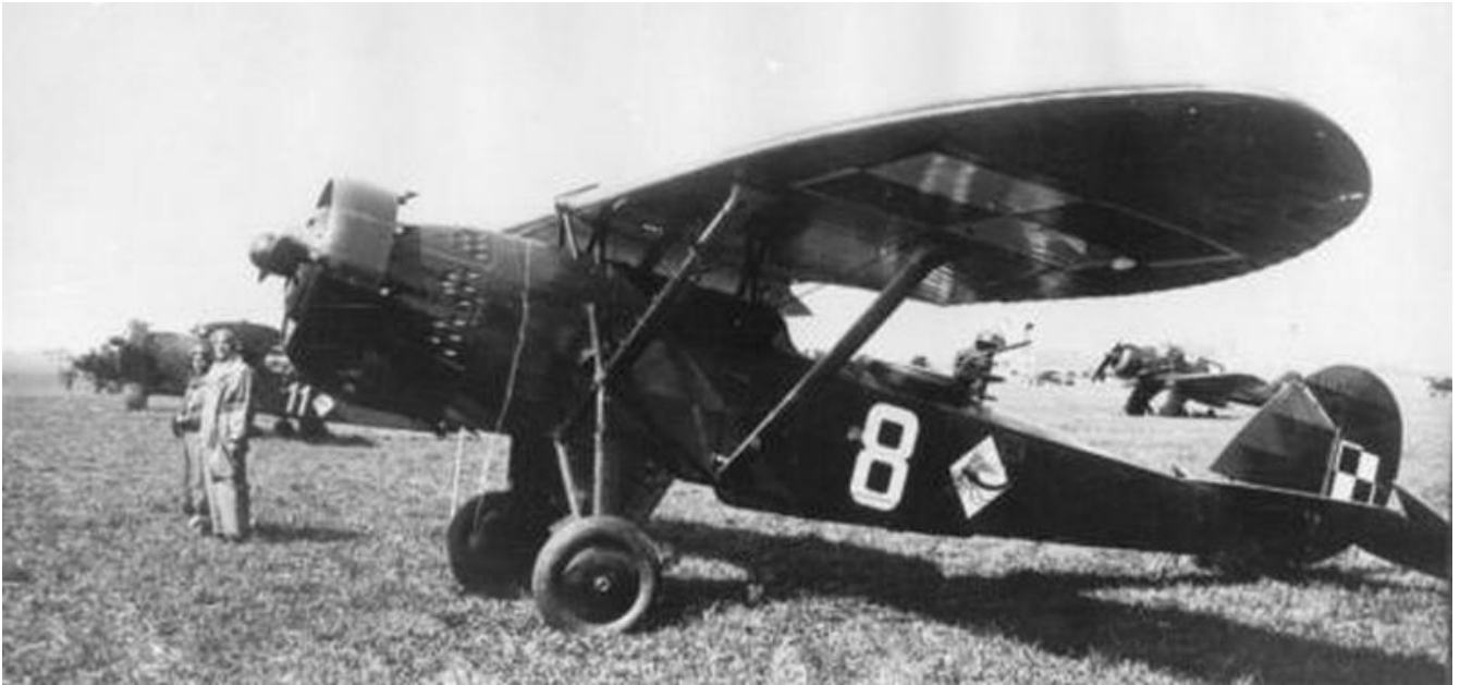
Godło 33. Eskadry Towarzyszącej 3. PL.