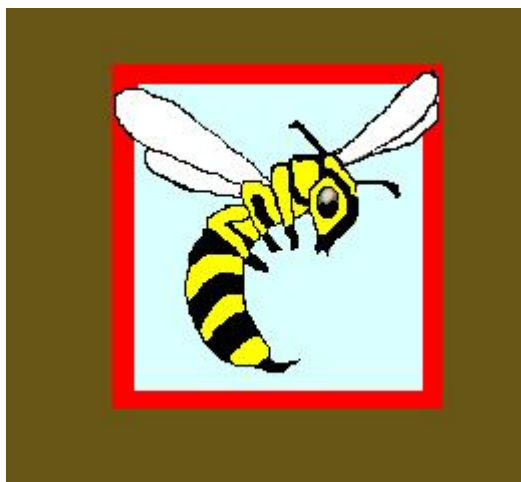
26 Eskadra Towarzysząca