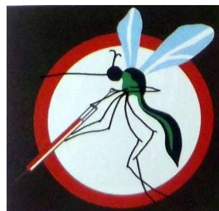
63 Eskadra rozpoznawcza

Przygotował i opracował: Aleksander Krawczyński