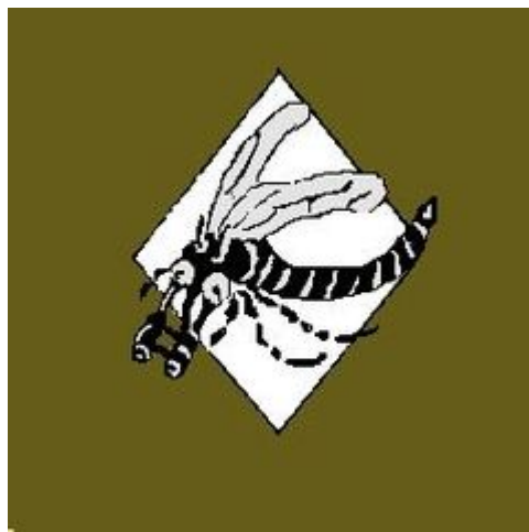
33 Eskadra Towarzysząca