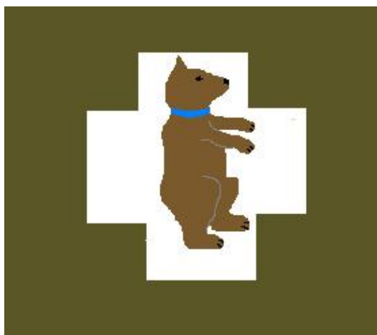
56 Eskadra Towarzysząca