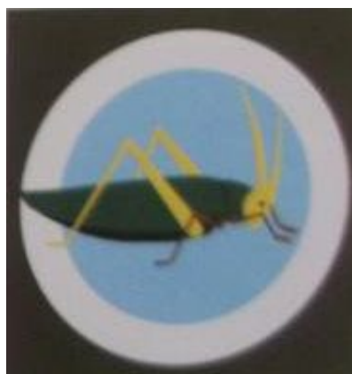
13 Eskadra Towarzysząca