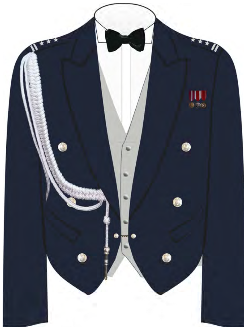
Rys. 1. Sposób noszenia miniaturk orderów i odznaczeń na półfraku munduru wieczorowego.

Załącznik do rozporządzenia Ministra Obrony Narodowej z dnia 4 sierpnia 2015 r. (poz. 1399)