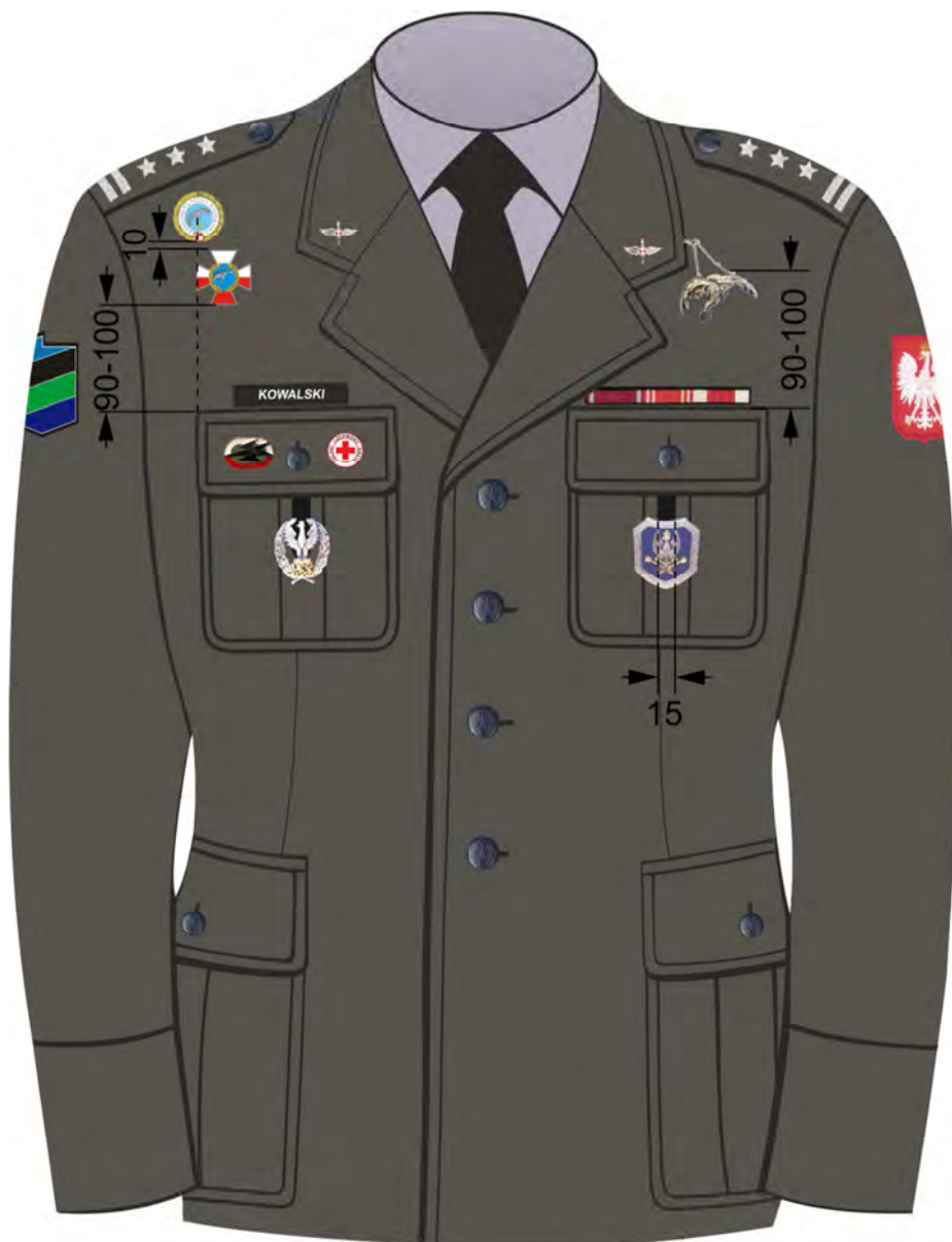
Rys. 6. Sposób noszenia baretek orderów, odznaczeń oraz odznak na kurtce munduru wyjściowego Sił Powietrznych.