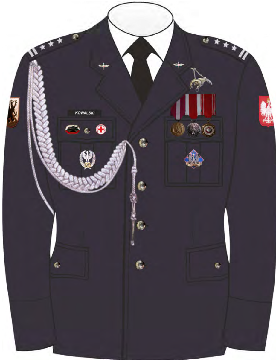
Rys. 3. Sposób noszenia odznak orderów, odznaczeń i odznak na kurtce munduru galowego Sił Powietrznych.