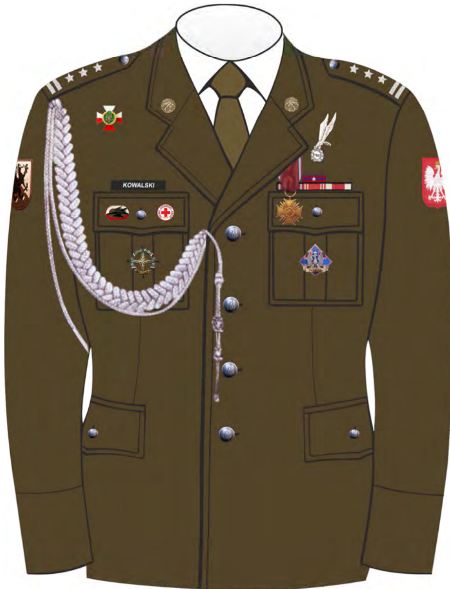
Rys. 2. Sposób noszenia odznak orderów, odznaczeń i odznak na kurtce munduru galowego Wojsk Lądowych.