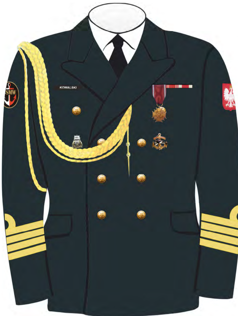
Rys. 4. Sposób noszenia odznak orderów, odznaczeń i odznak na kurtce munduru galowego Marynarki Wojennej.