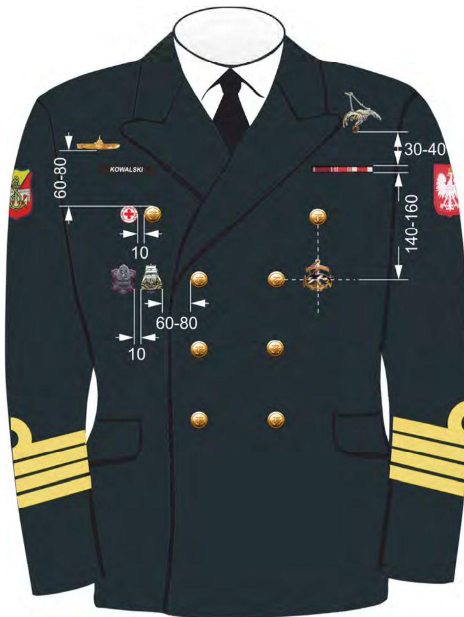
Rys. 7. Sposób noszenia baretek orderów, odznaczeń oraz odznak na kurtce munduru wyjściowego Marynarki Wojennej.