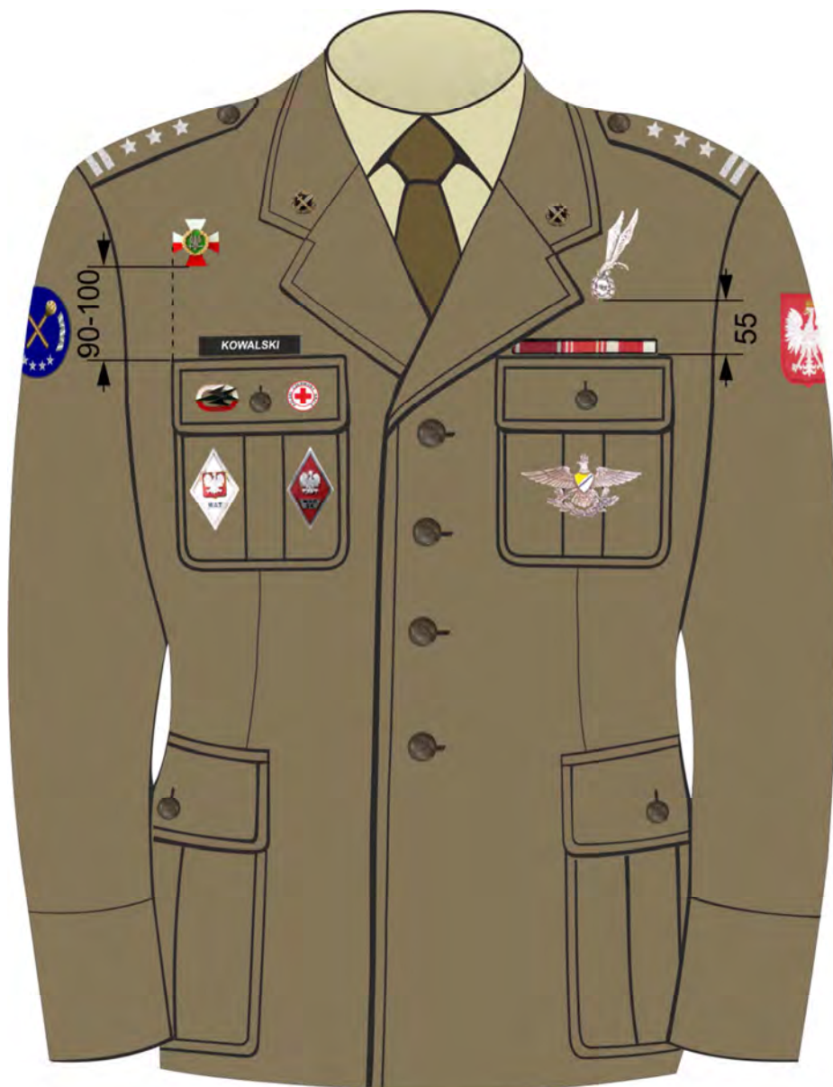
Rys. 5. Sposób noszenia baretek orderów, odznaczeń oraz odznak na kurtce munduru wyjściowego Wojsk Lądowych.