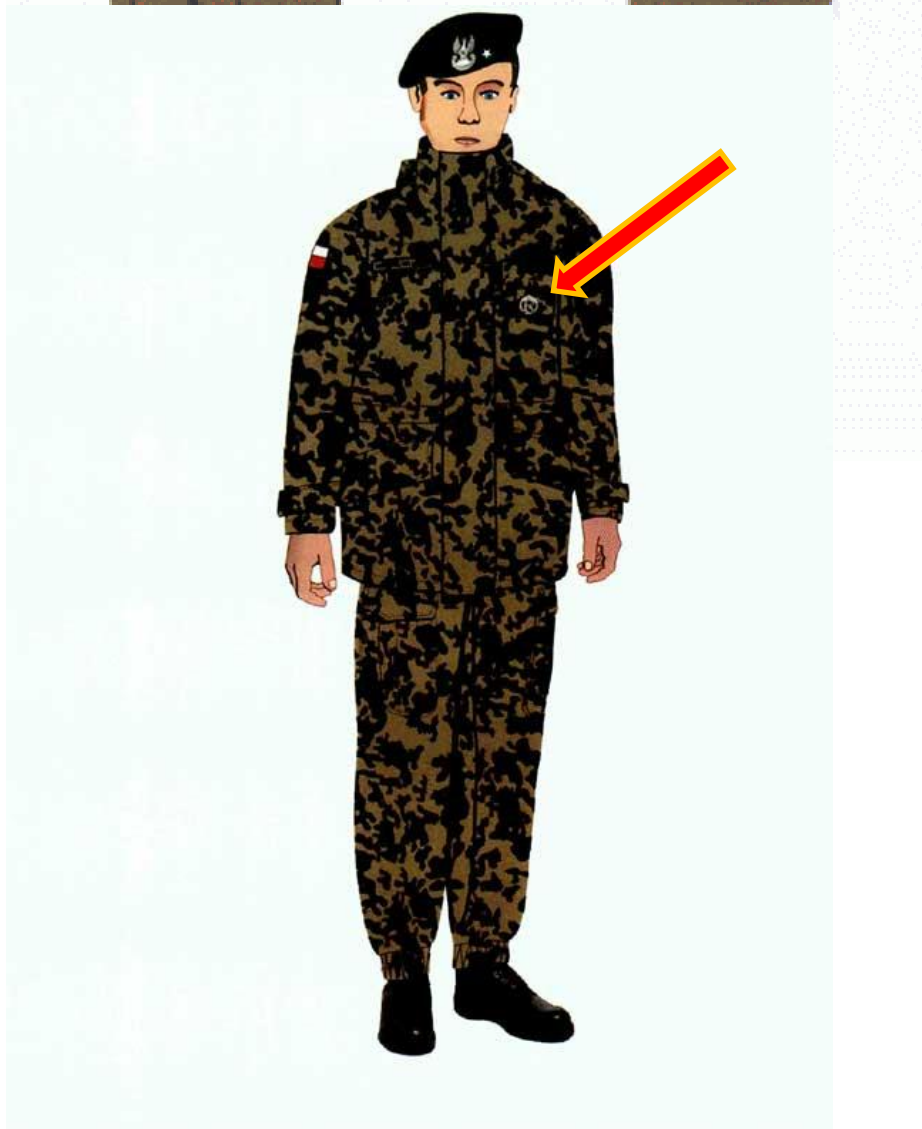
Rys. 11. Sposób rozmieszczenia oznaki identyfikacyjnej żołnierza rezerwy na kurtce ubioru ochronnego